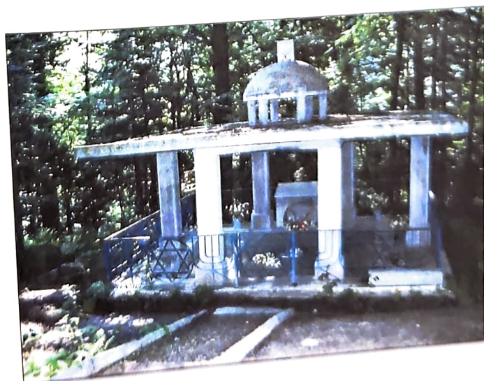
Pomnik stojący w miejscu masakry, w lesie na obrzeżach Brzozowa.