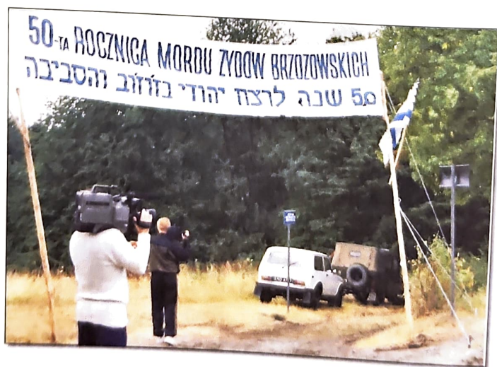
Upamiętnienie momentu wejścia do lasu przed dojściem, do pomnika.

Budowa pomnika nie była łatwa. Do miejsca budowy nie można było dojechać samochodami. Używaliśmy do tego koni, co i tak nie było łatwe. Musieliśmy wybudować mostek z pali aby przejść przez strumień (jak widać na zdjęciu).