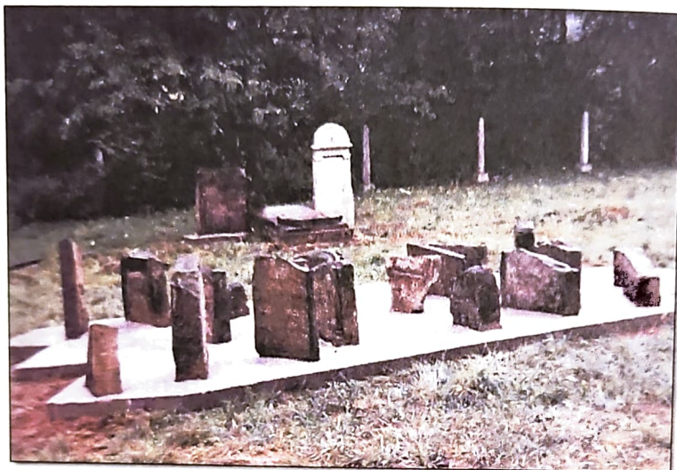
Odzyskane, pokruszone kamienie z grobów