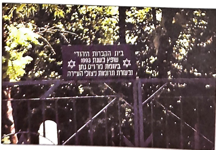
Ogrodzenie starego cmentarza