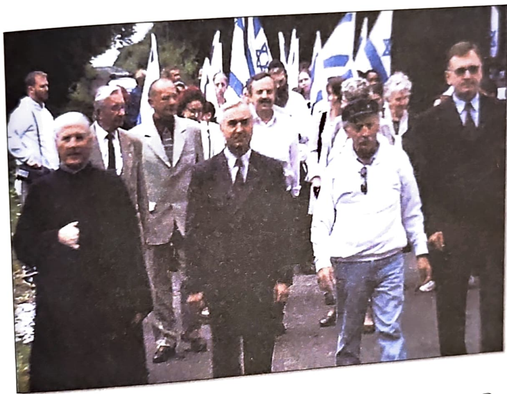
Delegacja młodzieży obchodzącej 60 rocznicę masakry w Brzozowie. Z przodu: ksiądz, burmistrz i ja.