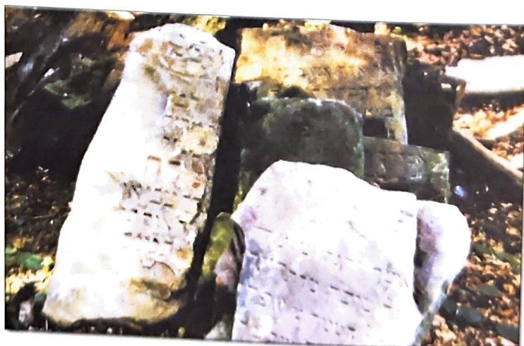
Fragmenty kamieni pochodzących z żydowskich grobów, znalezionych na chodniku.